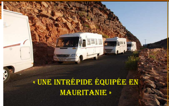
« UNE INTRÉPIDE ÉQUIPÉE EN MAURITANIE. »

Le 29 journée dans les dunes « inoubliable » : descentes vertigineuses , sensations fortes garanties ! Rencontre avec des nomades...thé !!! et quelques-uns s'essaient sur des chameaux ; pique-nique sous les arbres (rares) puis retour au camp, avec des descentes de dunes pour chauffeurs inexpérimentés : Denise a failli « éjecter » quelques passagers ! le soir, nos cuisiniers nous préparent des gigots d'agneau cuits dans le sable (un trou dans le sable , des braises , les gigots enveloppés dans du papier d'aluminium , des braises , le tout recouvert de sable ) délicieux !