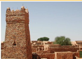
CHINGUITTY la capitale culturelle 7° lieu saint de l'Islam regroupait une grande communauté de savants musulmans

Après une courte sieste nous repartons et nous découvrons un nouveau paysage fait de montagnes stériles car nous arrivons dans la région des mines. Installation dans ce qui sera notre camp de base dans l'Adrar : c'est un terrain clos aménagé par Guy Martin comme un camping : toilettes, eau courante et lavabos, fosse de vidange mais pas de courant électrique ! nos camions y resteront 9 jours sous la garde des « shibanis » (personnes âgées très respectées par la population ) . Le 23 nous partons en 4X4 pour 2 jours : avec 4 véhicules, balade dans les dunes et apprentissage de la conduite dans le sable ...pas évident !! sous l'œil attentif de nos guides, 1 par véhicule (Guy , Aurélien , Akhmed et Sid'ahmed ) nous prendrons à tour de rôle le volant... génial !!! nous rencontrons ça et là des nomades, accueil toujours aussi chaleureux...et toujours le thé ( 3 ! ) .