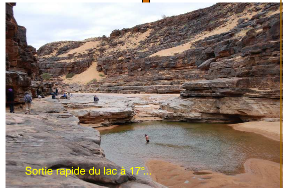
Sortie rapide du lac à 17°..