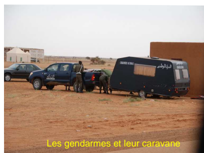
Les gendarmes et leur caravane