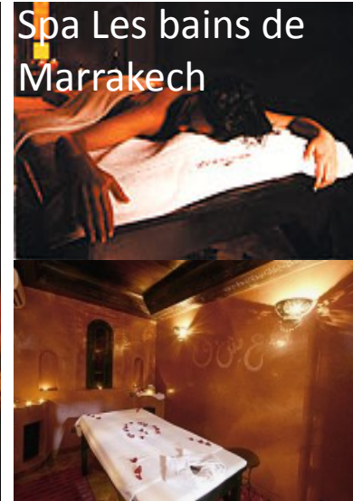
Spa Les bains de Marrakech