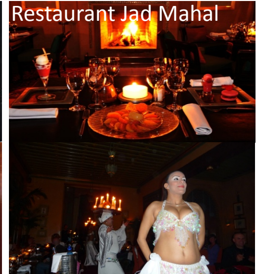
Restaurant Jad Mahal