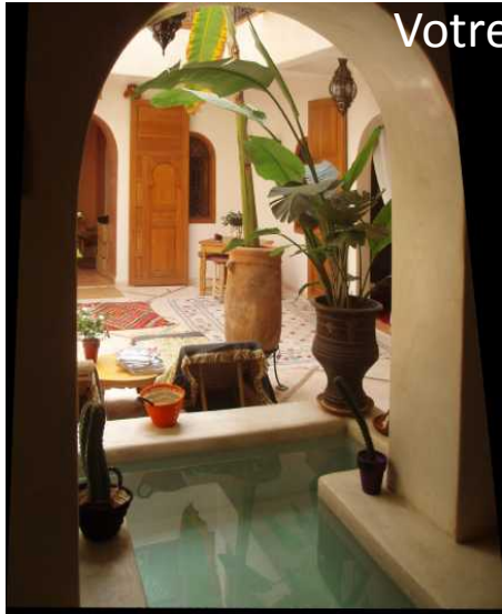
Votre Riad en exclusivité